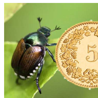
Figura 1: coleottero giapponese a confronto con una moneta da 5 cts.

Il coleottero giapponese ( Popillia japonica , Pj), classificato come organismo di quarantena prioritario, si distingue per la presenza di ciuffi pelosi bianchi (5 laterali e 2 più grandi nella parte posteriore) e per le sue piccole dimensioni, ovvero inferiori a una moneta da 5 cts (Figura 1). Esistono altri coleotteri molto simili coi quali ci si può confondere durante la determinazione. Nella Figura 2 sono illustrate le specie di insetti più comuni simili a Pj.