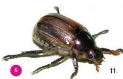
5 Mimela junii Il giugnino Mimela junii , 13-16 mm, possiede elitre di colore verde dorato e molti peli diffusi che non si distinguono in ciuffi bianchi. Ha una forma più ovale rispetto al coleottero giapponese.