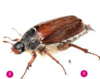
2 Melolontha melolontha Il comune maggiolino, 25-30 mm, non possiede ciuffi bianchi.