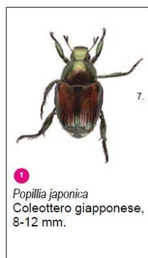
1 Popillia japonica Coleottero giapponese, 8-12 mm.