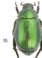
4 Anomala vitis Le specie appartenenti al genere Anomala ( Anomala vitis ), 14-18 mm e ( Anomala dubia ), 11-15 mm, sono interamente di colore verde tendente al marrone-nerastro.